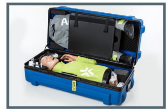
Carcasa transporte Ambuman Advanced