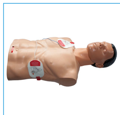
Colocación de las almohadillas del desfibrilador