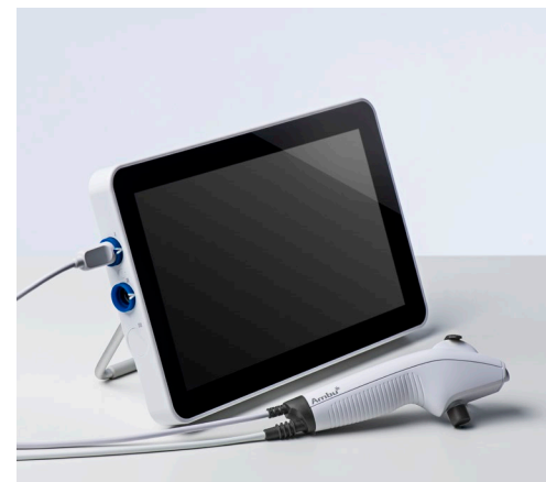
Ambu® aScope™ 4 Broncho Slim y Ambu® aView™ 2 Advance.