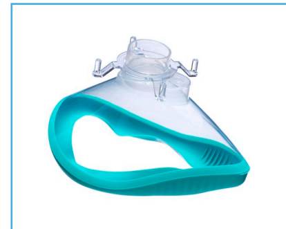
Ambu® Mascarilla Desechable Manguito Abierto.