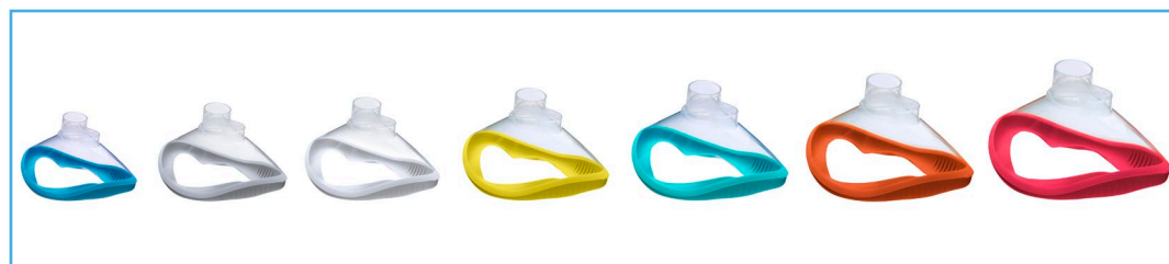
Ambu® Mascarilla Desechable Manguito Abierto.