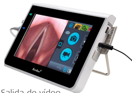
Salida de vídeo