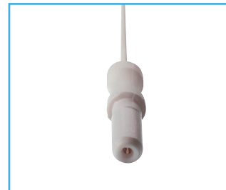
K = Conector 1,5 mm.