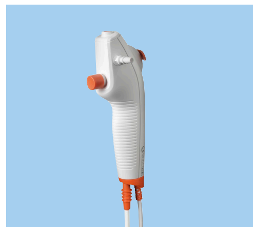
Mango ligero y ergonómico diseñado para ofrecerle un agarre más firme y cómodo.