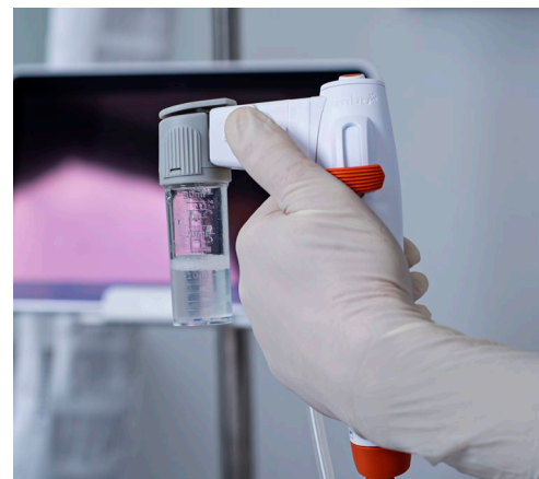
Ambu® aScope™ 4 Broncho Large con aScope BronchoSampler™ y Ambu® aView™ 2 Advance.