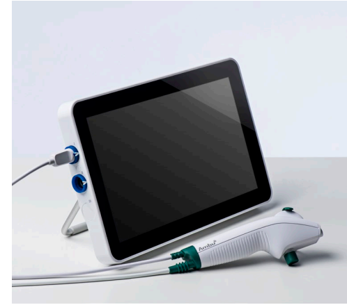
Ambu® aScope™ 4 Broncho Regular y Ambu® aView™ 2 Advance.