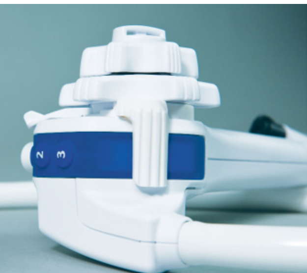
Palanca de control del elevador para elevar (arriba) y bajar (abajo) el elevador