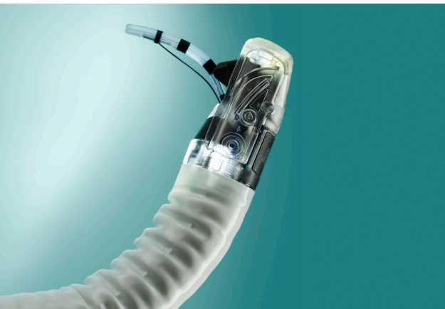
Punta distal demostrando el funcionamiento del elevador con un esfinterotomo

Con aScope™ Duodeno, tienes un endoscopio nuevo con un rendimiento consistente en todo momento, y no hay riesgo de contaminación cruzada. Además, no es necesario realizar costosos reprocesamientos o reparaciones.