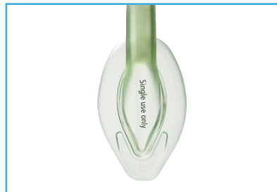
AuraStraight con punta reforzada.