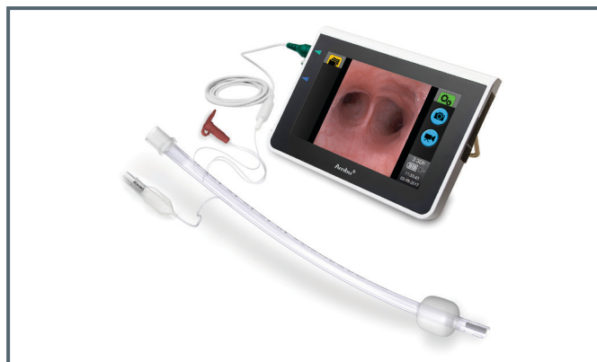
VivaSight-SL conectado a monitor Ambu® aView™