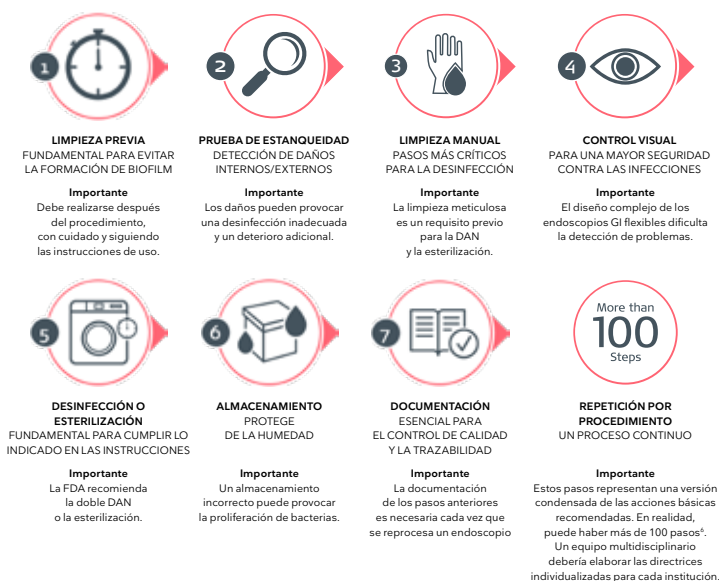
Imagen 1: Ilustración simplificada del ciclo de reprocesamiento del endoscopio.

Después de la DAN, se espera que se eliminen todas las unidades formadoras de colonias bacterianas (UFC), aunque es posible que se sigan detectando esporas bacterianas [3,4]. Sin embargo, no es inusual que los endoscopios permanezcan contaminados después de la DAN e incluso después una doble DAN [5,6]. Se ha observado que los endoscopios gastrointestinales reprocesados y listos para su uso en pacientes están contaminados, no solo por la falta de cumplimiento de los protocolos de reprocesamiento, sino también en aquellos entornos que habían aplicado las instrucciones de reprocesamiento adecuadas del fabricante durante el proceso de limpieza [7-9]. En concreto, el mecanismo elevador del duodenoscopio ha sido un elemento de preocupación en relación con la contaminación, ya que la Agencia de Alimentos y Medicamentos de EE. UU. (FDA) ha publicado varias comunicaciones de seguridad relativas a infecciones por patógenos multirresistentes en pacientes sometidos a colangiopancreatografía retrógrada endoscópica (CPRE) con duodenoscopios contaminados [10-12]. Sin embargo, varios estudios sugieren que los problemas de contaminación no solo se limitan al mecanismo elevador del duodenoscopio, sino que también son comunes en los canales endoscópicos de gastroscopios y colonoscopios. Es importante destacar que un endoscopio contaminado no provocará una infección en todos los casos, ya que la relación entre los dispositivos contaminados y los pacientes contaminados no es 1:1.